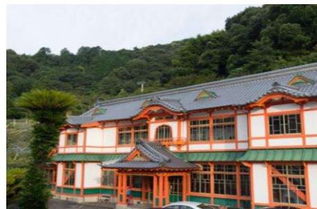
国指定重要文化財 武雄温泉新館