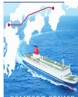
名門大洋フェリー